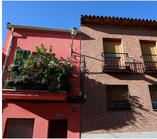
Las calles Santa Ana Alta y Santa Ana Baja están entre las más significativas de la esencia del viejo Fuencarral.