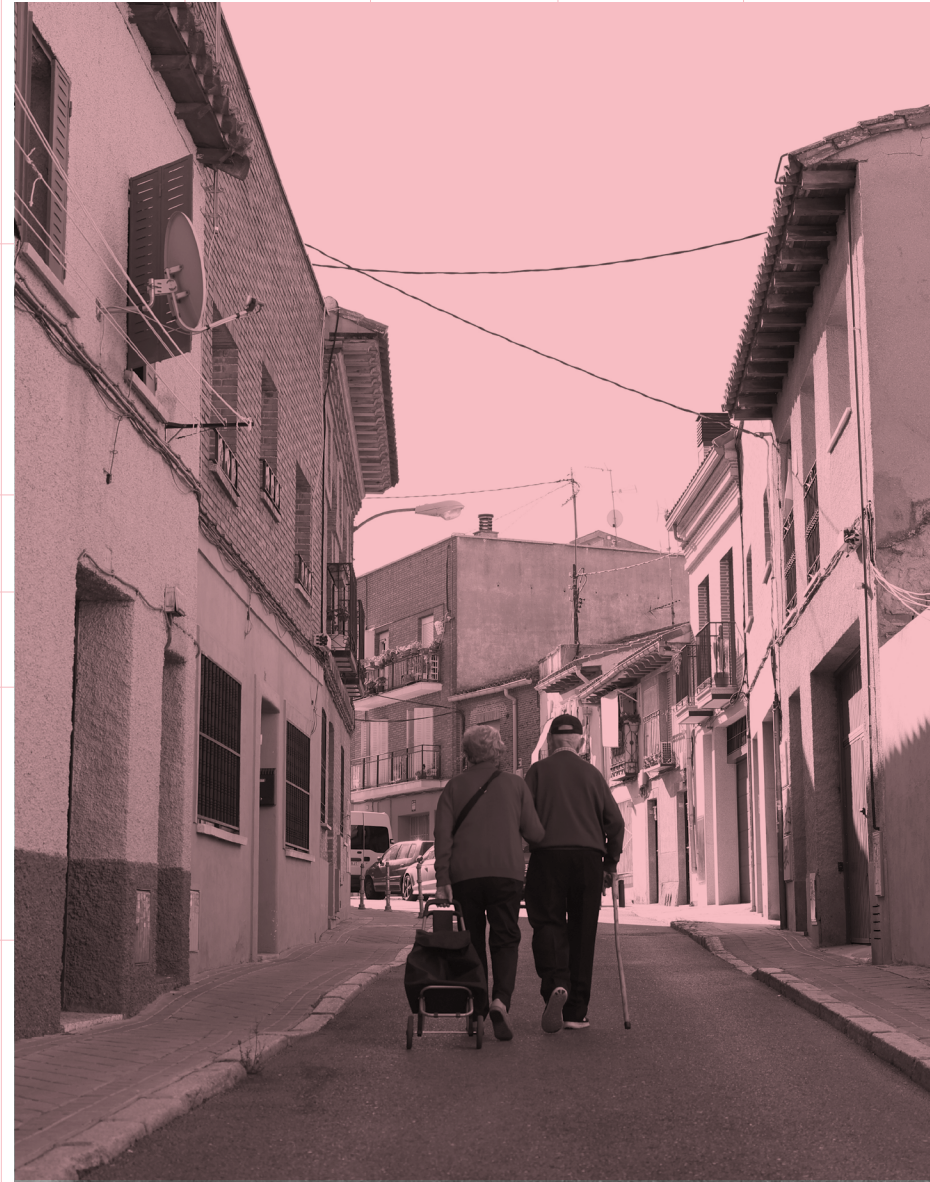
La continuidad del tejido social del barrio a lo largo de los siglos ayuda a explicar su marcada identidad.