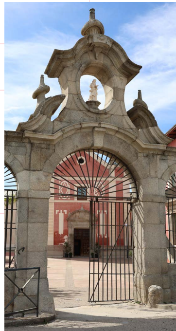
Santuario de Ntra. Sra. de Valverde (del s.XIII al XVIII)