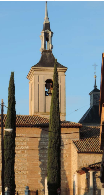
Parroquia de San Miguel Arcángel (del s.XIV al XVII)

Pocos edificios, pero muy representativos de la identidad local, ya sean construcciones religiosas o civiles y cada una con su personalidad particular.