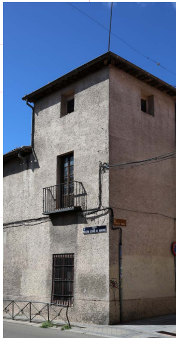
Casa Grande (s.XVI)